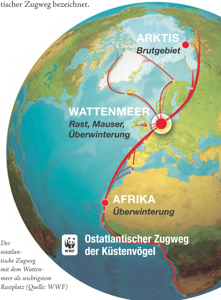
Der ostatlantische Zugweg mit dem Wattenmeer als wichtigstem Rastplatz

Für die Rastvögel ist das Wattenmeer ein überlebenswichtiger Stopp zwischen den Brutgebieten im Norden und den Überwinterungsgebieten im Süden. Die Brutgebiete liegen in der arktischen Tundra, in einem Bereich von Nordost-Kanada bis Nordwest-Sibirien. Die Überwinterungsgebiete reichen vom Wattenmeer selbst über die Britischen Inseln bis zu den Küsten West- und Südafrikas. Dieser riesige Raum wird als Ostatlantischer Zugweg bezeichnet.