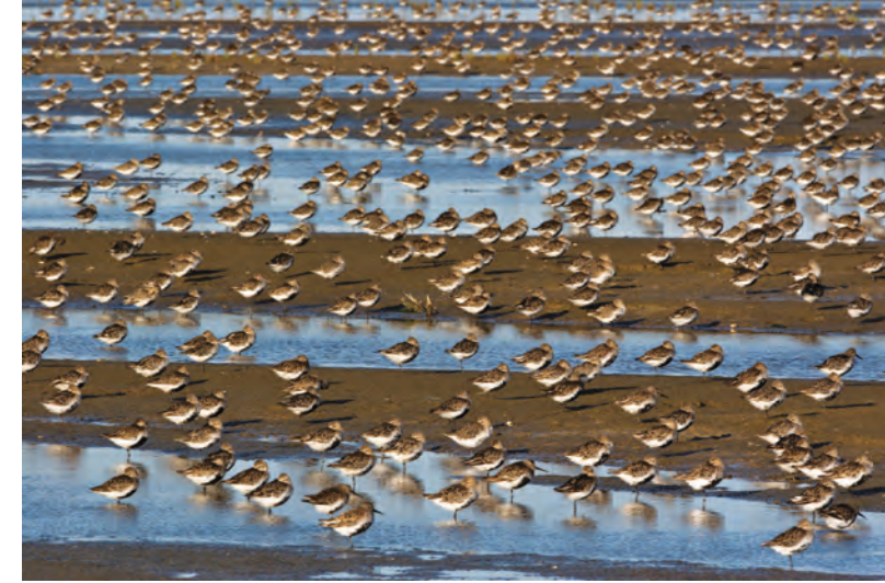
Rastende Alpenstrandläufer im Watt